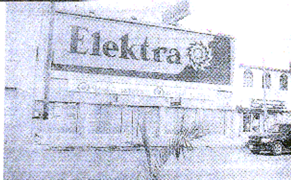
■ ESTA negociación fue visitada por los ladrones llevándose cámaras fotográficas digitales y de video.