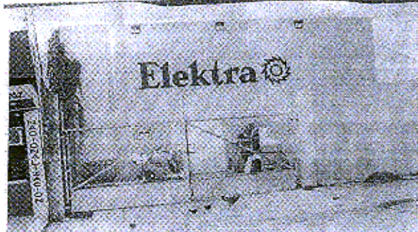
■ SE PRESUME que por aquí entraron los ladrones subiendo a la parte de arriba del negocio y se metieron por los ductos del aire acondicionado.