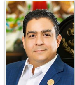
DIP. ISMAEL GARCÍA CABEZA DE VACA VOCAL